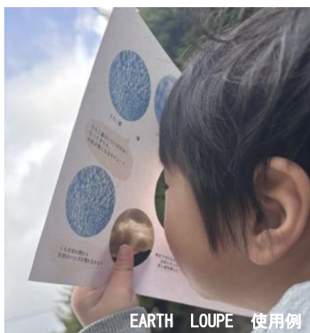
空をのぞきこんでみよう