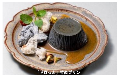
「ドロっと」竹炭プリン