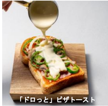
「ドロっと」ピザトースト