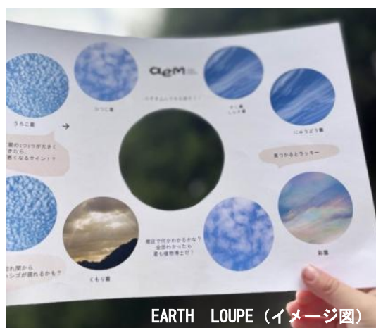
今日のお空はどんな雲かな