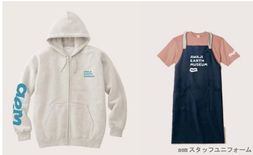
aem スタッフユニフォーム

これらの飲食メニューは地域と連携して地産地消に努めており、さらに廃棄分はコンポストにして堆肥化し、GARDEN で活用します。さらに、GARDEN での収穫物を提供する計画も進んでおり、リジェネラティブなコンセプトを実現しているカフェレストランです。