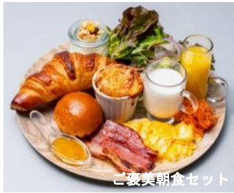
ご褒美朝食セット