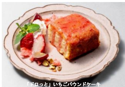
「ドロっと」いちごパウンドケーキ