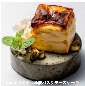
aem オリジナル地層バスクチーズケーキ

aem で食べていただきたいのは、淡路島チーズ工房様とコラボ開発したキューブ型のバスクチーズケーキ。クリーミーで見た目もかわいい aem オリジナルバスクチーズケーキをぜひご堪能ください。そしてコンセプトメニュー「地層」シリーズでは、地層ティラミスやイチゴパフェ、オニオンリングを積み上げて地層に見立てた“地層ニオンリング”をご用意。「ドロ」シリーズでは、地元で栽培・加工された冷凍苺を使用したイチゴソースがかかるとドロっとかかるパウンドケーキや、食べる直前にプリン型の底に穴をあけるとドロっとしたソースがかかる仕組みの「ドロっと」プリン、本来は廃棄されてしまう牛乳の搾りかす“ホエイ”を活用した「飲む美活 aem ホエイ」ドリンクなど盛りだくさん。TAOCA COFFEE 様焙煎のコーヒー、地元農家のフルーツを使ったフルーツティーなど、カフェタイムのメニューはオリジナルのコンセプトメニューが勢揃い。