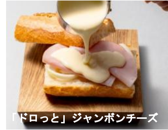
「ドロっと」ジャンボンチーズ