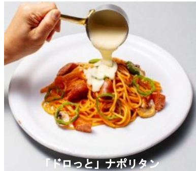
「ドロっと」ナポリタン

生パスタ+パン・サラダ食べ放題のランチビュッフェ。淡路島の食材をふんだんに使用したソース&淡路麺業様の生麺パスタをご用意。注目メニューはコンセプトメニュー「ドロ」シリーズのひとつ、チーズソースをかける「ドロっと」ナポリタンです。