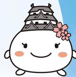
姫路市キャラクター しるまるひめ

Discount Ticket for Kobe-Sanda Premium Outlets®